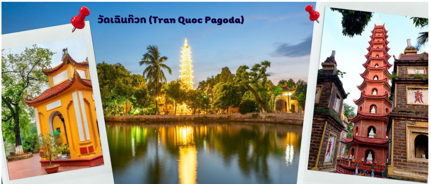
วัดเจินก๊วก (Tran Quoc Pagoda)

จากนั้นนำท่านไป วัดเจินก๊วก (Tran Quoc Pagoda) เป็นวัดที่อยู่ใจกลางเมืองของเวียดนาม ใกล้ชิดกับ ทะเลสาบตะวันตกของเมืองฮานอย สร้างด้วยสถาปัตยกรรมจีนโบราณ มีความร่มรื่น และบรรยากาศดี จึง เป็นที่นิยมของนักท่องเที่ยวทั้งที่ชื่นชอบความงามและมีศรัทธาในพระพุทธศาสนา จากภาพมุมสูงของสถานที่ตั้ง ที่นี่เหมือนตั้งอยู่บนเกาะที่ยื่นลงไปทะเลสาบ แต่มีเส้นทางคมนาคมเข้าถึงที่ สิ่งปลูกสร้างมีการวางผังเป็นอย่างดี ใช้สีสันทึกลมกลืนในโทนสีเหลือง น้ำตาล ตัดกับสีเขียวของต้นไม้ใหญ่ที่โอบล้อมอยู่ ในมุมถ่ายภาพจากอีกฝั่งหนึ่ง จะเห็นสิ่งปลูกสร้างสไตล์จีน และเจดีย์หลายชั้นโดดเด่น มีภาพที่สะท้อนลงสู่ผืนน้ำ เป็นภูมิทัศน์ที่งดงามทั้งยามกลางวันและยามค่ำคืนที่มีการเปิดไฟส่องสว่าง