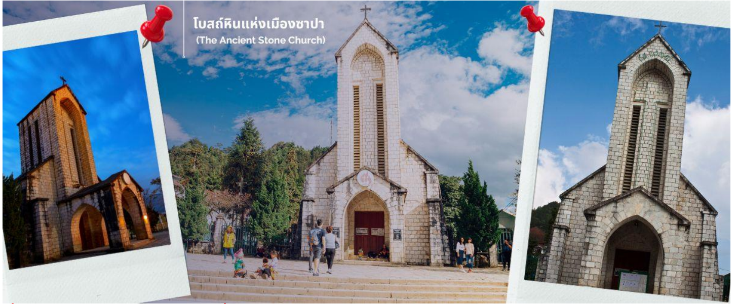
โบสถ์หินแห่งเมืองซาปา (The Ancient Stone Church)

ในตอนนี้อาชาวฝรั่งเศสจะย้ายกลับไปแล้ว แต่โบสถ์แห่งนี้ก็ได้รับการอนุรักษ์เอาไว้เป็นอย่างดีและชาวซาปาที่เป็นคาทอลิกก็ยังคงใช้งานอยู่จนปัจจุบัน นำท่านช้อปปิ้งที่ ตลาดไนต์เมืองซาปา มีสินค้าให้ท่านเลือกช้อปปิ้งมากมาย ไม่ว่าจะเป็นสินค้าพื้นเมืองของฝาก ขนม กระเป๋า รองเท้า ท่านสามารถช้อปปิ้งได้อย่างจุใจ